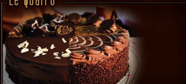
8 po / 1000 g / C 310