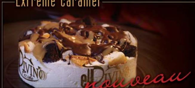
6 po / 450 g / C869