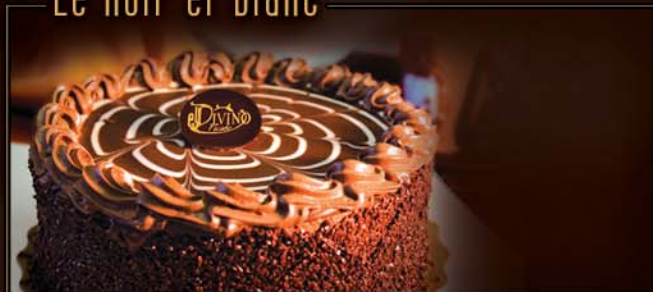
6 po / 575 g / C304