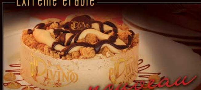
6 po / 450 g / C870