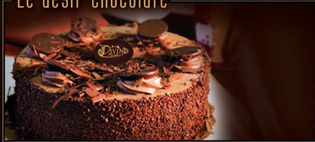
6 po / 500 g / C308