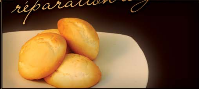
Préparation à galettes

Offerte en diverses saveurs Vendue en 4.53 kg prête à cuire