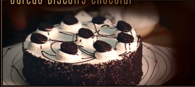
Gâteau biscuits chocolat