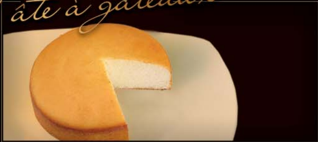
Pâte à gâteaux

Chocolat et vanille disponible en plusieurs formats