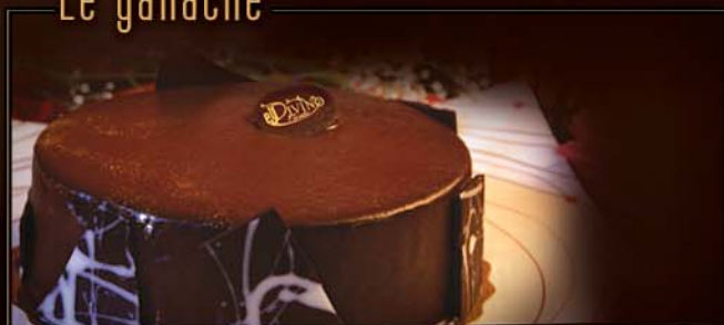
6 po / 500 g / C 308