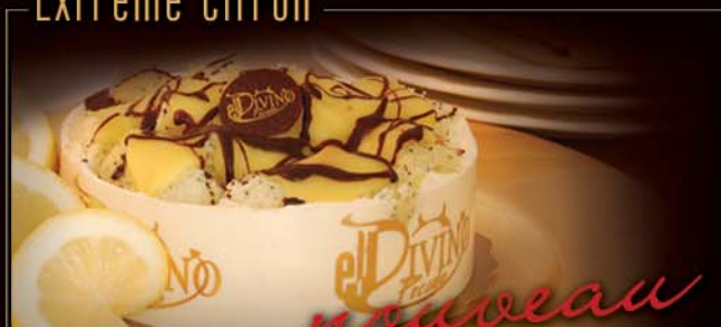
6 po / 450 g / C871